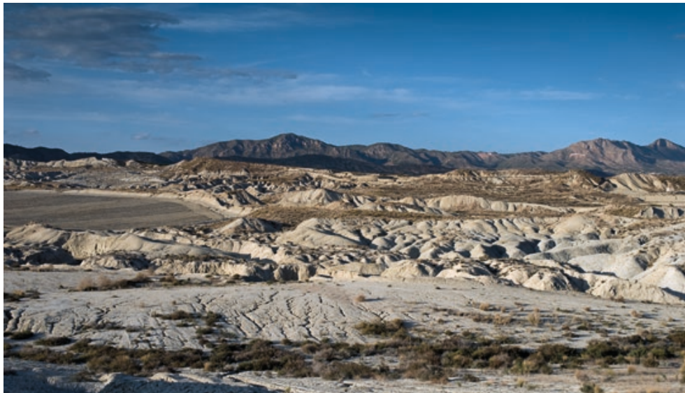
Barrancos de Abanilla